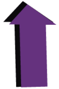
Illustration by: Saul Lustgarten