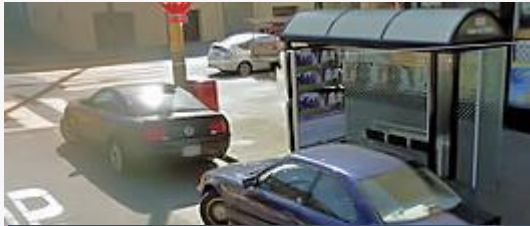
חניה בתחנת אוטובוס