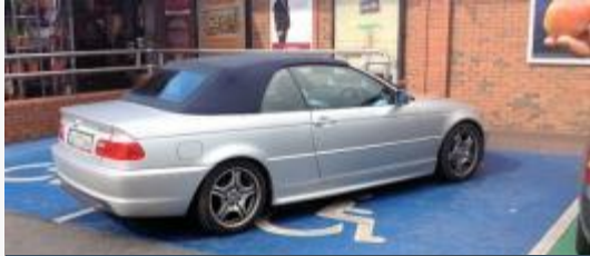
חניה בחניית נכה

המערכות של סייפר פלייס מכסות את כל סוגי עבירות חניה מוניציפאליות בישראל