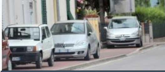
חניה על המדרכה