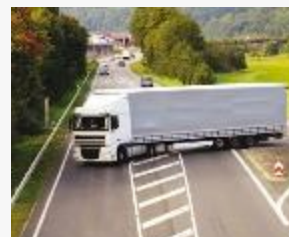
פניות לא חוקיות