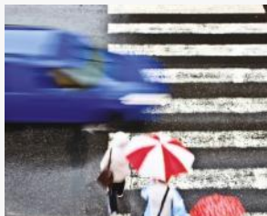
אי מתן זכות קדימה