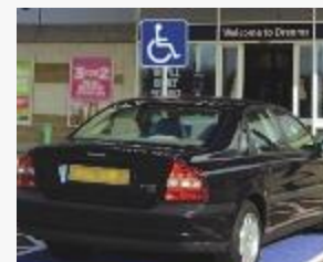
חניות לא חוקיות