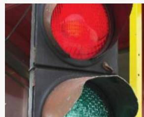
חציית אור אדום