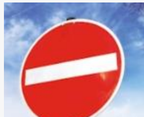
אי ציות לתמרורים