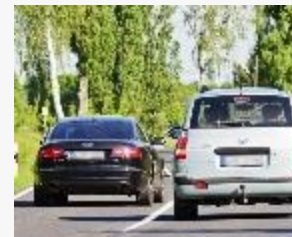
חיתוך קו הפרדה לבן