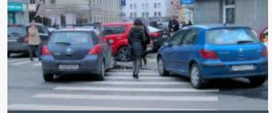
חניה על מעבר חצייה