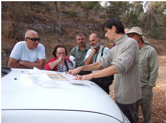
תכנון יער מאכל עם קק"ל ביער ירושלים