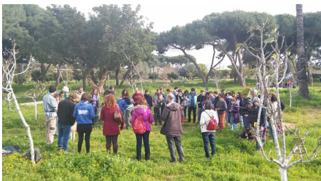
מפגש קהילת יער מאכל דרום תל אביב-יפו