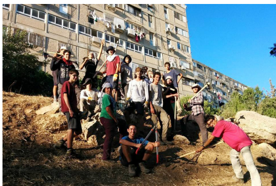
תושבים מקימים יער מאכל בירושלים

מוסדרת בנושא של יערות מאכל וחקלאות אקולוגית, כל זאת על מנת להגשים חזון להקמת רצף אקולוגי של יערות מאכל לאורכה של מדינת ישראל, אשר יהווה שיקום אקולוגי וביטחון תזונתי לתושביה.