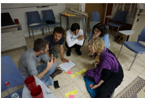
תמונה ממפגש של הפורום הארצי ליערות מאכל